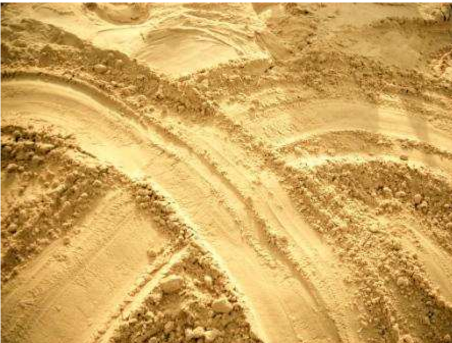
Mani su sabbia