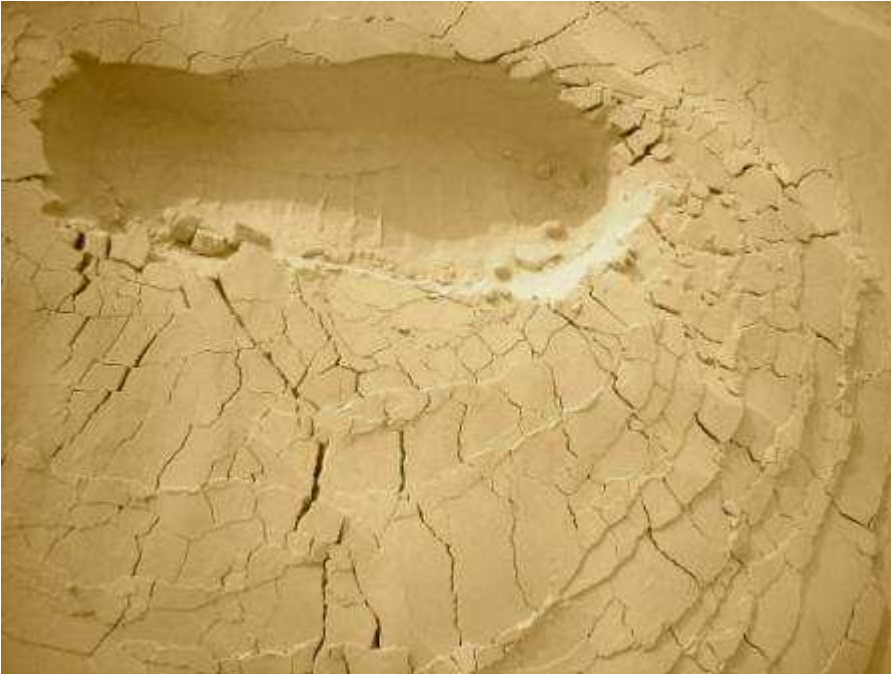
Passo su sabbia